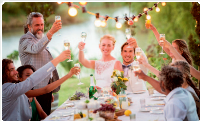
Gemeinschaftsanzeige der inserierenden Firmen

Bevorzugt werden luftige und leichte Röcke aus Chiffon und Softfüllstoffen, auch ein Trend zu schlichten Kleidern in cleanen Satinstoffen zeichnet sich ab. Andererseits gibt es aber auch einen Trend zur Extravaganz mit dramatischen Röcken mit Puffys und Corsagen in V-Form. Ebenfalls sehr beliebt sind wieder lange Schleier. Eleganz, kombiniert mit pompösen Details, sind 2025 besonders gefragt. Minimalistische Schnitte mit klaren Linien stehen im Fokus. Zarte Spitzenapplikationen, glatte Stoffe, raffinierte Details und moderne Statements, wie abnehmbare Ärmel oder große Volants, sind nicht wegzudenken. Die Braut, welche auf Trends setzt und 2025 hei-