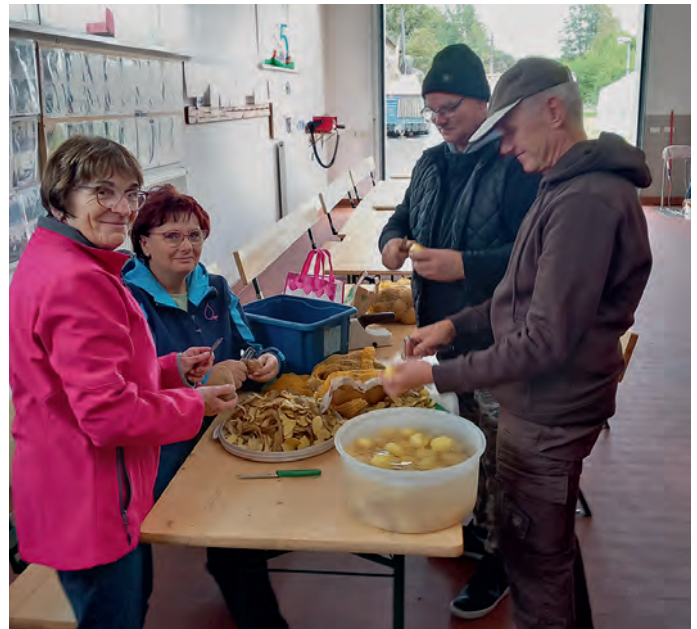
Immer bereit: freiwilliger Einsatz in der Pommesproduktion