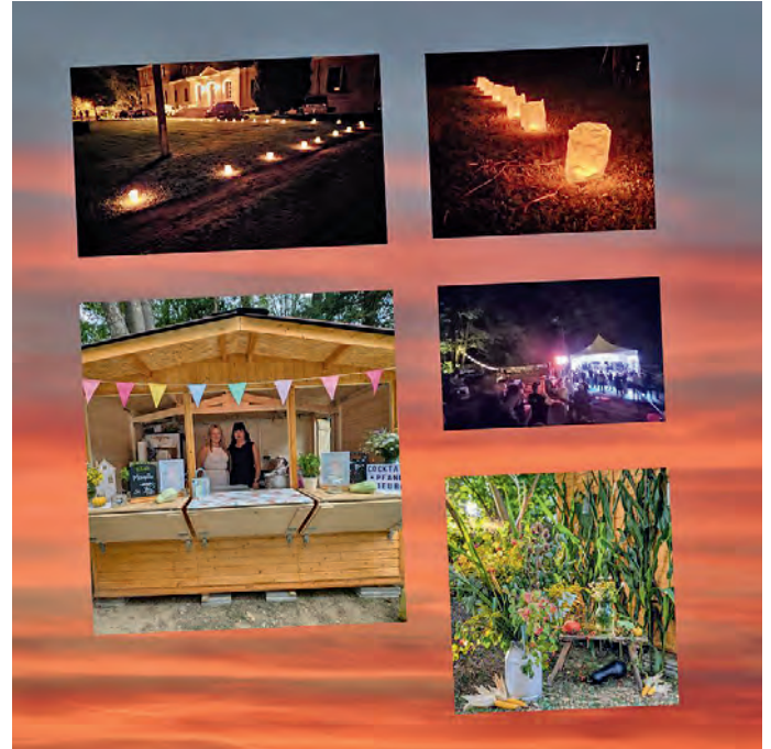
tolle Beleuchtung und Deko, Cocktailbar mit Antje und Doreen