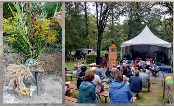
Dank unseren Dekofern, Blick auf gut besuchtes Heckentheater schon am Nachmittag