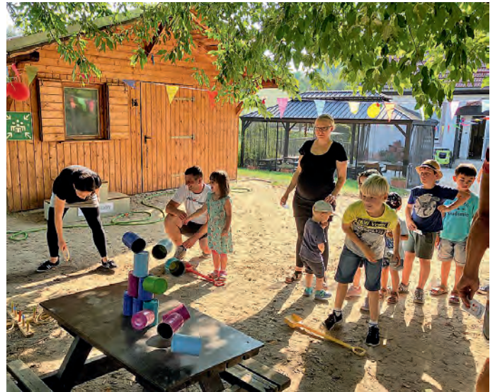
Familienfest – Dosen werfen

Von einem spannenden Schubkarrenparcours bis hin zu Bällen fischen war für jeden etwas dabei. Die Eltern waren nicht nur Zuschauer, sondern wurden aktiv in die Spiele eingebunden, was für viel Freude und Lachen sorgte. Es war schön zu sehen, wie Familien zusammenarbeiteten und sich gegenseitig anfeuert.