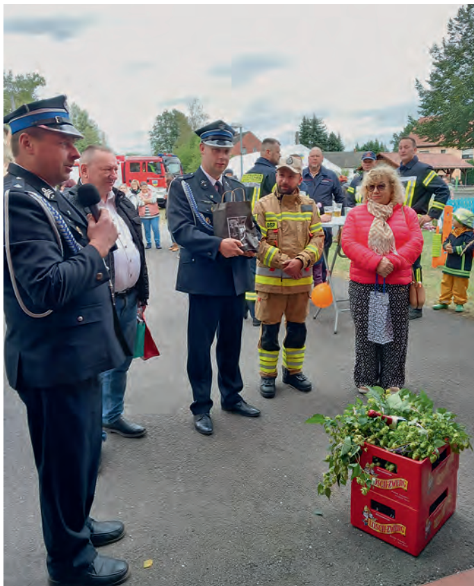
Gratulacja! Die Kameraden aus Piensk und den Nachbarorten überbringen frisches Löschwasser

Liebe Kameradinnen und Kameraden, habt Dank fürs Retten, Löschen, Bergen und Schützen bei Tag und Nacht – und diese Feier, die uns allen einen Hoffnungsfunken in einer regenreichen und Flut drohenden Woche Mitte September schenkte. Solange es Euch gibt, ist unsere Nachbarschaft bestens geschützt!