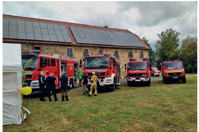
Fachlicher Austausch an den Löschfahrzeugen der Gemeinde Neiße

Wir suchen für unseren modernen Filialverbund: