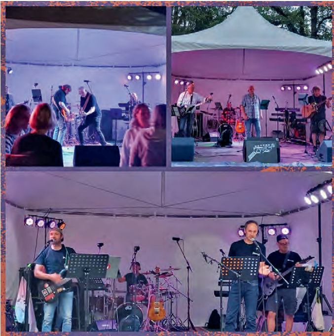
Bands von links oben: Madrigal, 1965, Schloßbrocker