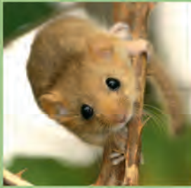
Bild Haselmaus: © Björn Schulz (= User Bjoernschulz on de.wikipedia), CC-BY-SA 3.0