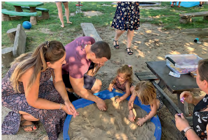
Familienfest – Kristalle ausgraben

Von einem spannenden Schubkarrenparcours bis hin zu Bällen fischen war für jeden etwas dabei. Die Eltern waren nicht nur Zuschauer, sondern wurden aktiv in die Spiele eingebunden, was für viel Freude und Lachen sorgte. Es war schön zu sehen, wie Familien zusammenarbeiteten und sich gegenseitig anfeuert.